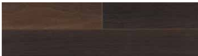
Kouřový dub tmavý UW 1540